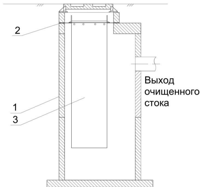
Рис. 1 – на стеновое кольцо,

1 – Бетонный колодец. 2 – Опорное кольцо. 3 – Фильтр-патрон. 4 – Сорбционная загрузка. 5 – Механическая загрузка патрона. H1 – min 200-300 мм, H2 – 2/3 высоты патрона.