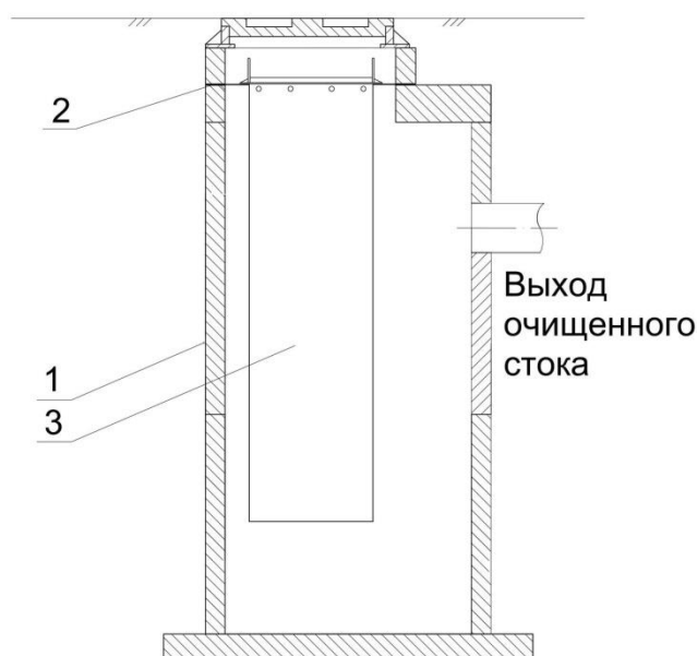
Рис. 1 – на стеновое кольцо,