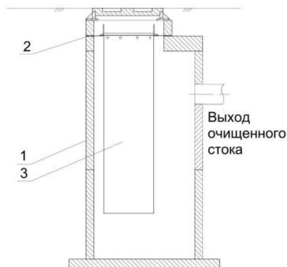
Рис. 2 – на бетонную плиту под люк.

1 – Бетонный колодец. 2 – Опорное кольцо. 3 – Фильтр-патрон. 4 – Сорбционная загрузка H1 – min 200-300 мм, H2 – 2/3 высоты патрона.