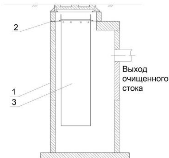
Рис. 2 – на бетонную плиту под люк.

1 – Бетонный колодец. 2 – Опорное кольцо. 3 – Фильтр-патрон. 4 – Сорбционная загрузка H1 – min 200-300 мм, H2 – 2/3 высоты патрона.